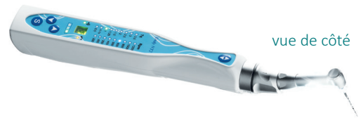
vue de côté

L'Endy NT2 possède 10 mémoires vous permettant de programmer autant de couples et vitesses adaptés pour chaque lime utilisée. Sa programmation est simple et intuitive.