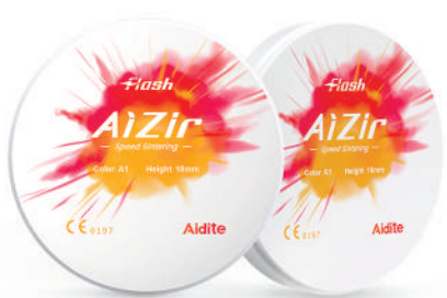
Zircon Aizirflash pour frittage rapide