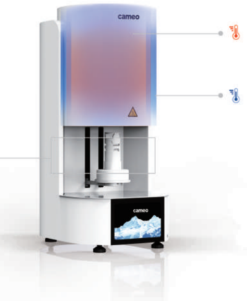
Bonne isolation thermique du four.